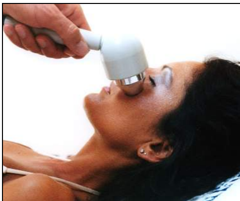
Fig.1 – Foruncoli - granulomi del viso