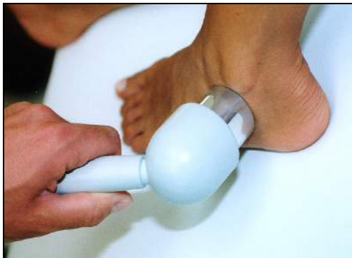
Fig.16 - Distorsione di caviglia