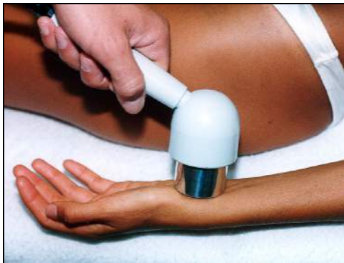
Fig.2 - Artrite del polso