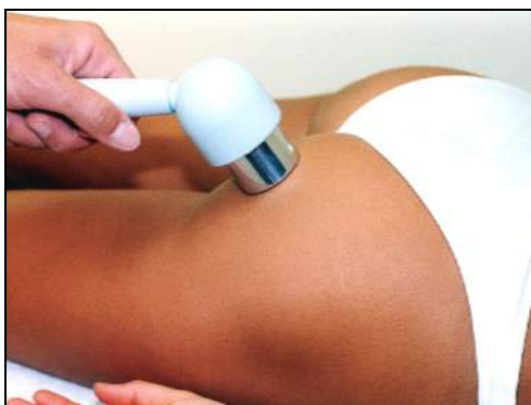
Fig.5 - Glutei