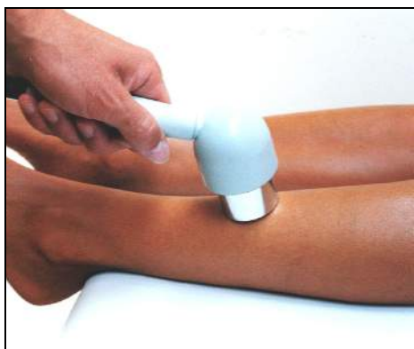
Fig.13 - Periosite