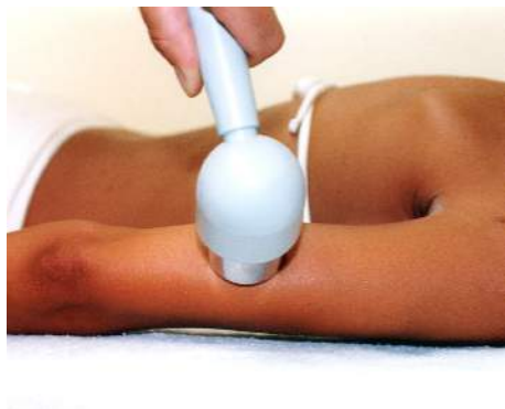
Fig.7 - Braccia