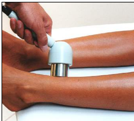
Fig.14 - Callo osseo su tibia