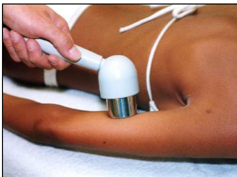
Fig.4 - Ritardo di ossificazione dell'omero