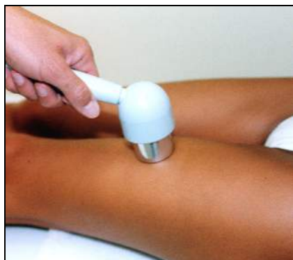
Fig.9 - Strappo/contrattura al quadricipite