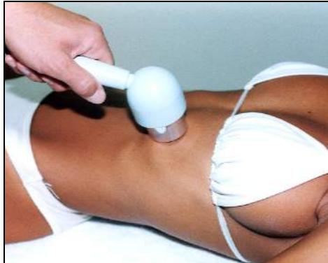
Fig.6 - Contusione alle coste