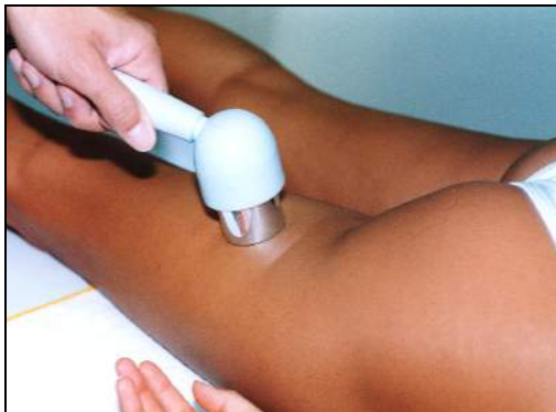
Fig.10 - Strappo-contrattura ai flessori