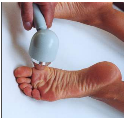
Fig.2 - Verruche