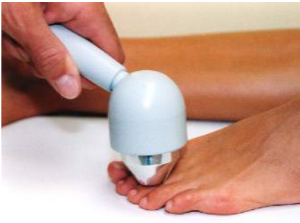
Fig.21 – Artrite delle dita del piede