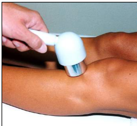
Fig.12 - Borsite rotulea