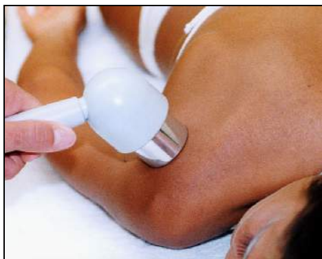
Fig.5 - Periartrite di spalla