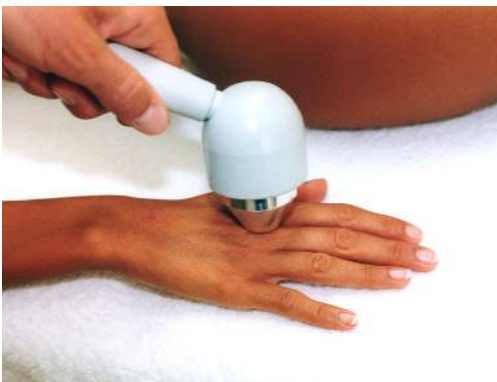
Fig.18 - Artrite delle articolazioni della mano