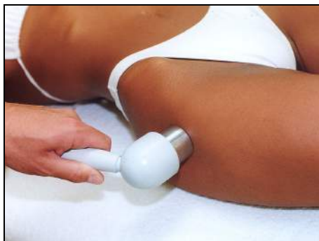
Fig.8 - Artrosi dell'anca