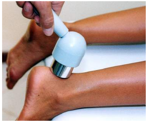
Fig.20 – Tendinite achillea