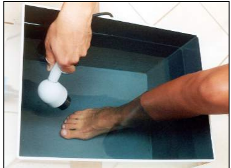
Fig.18 - Artrosi del piede in immersione