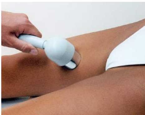
Fig.8 - Interno cosce