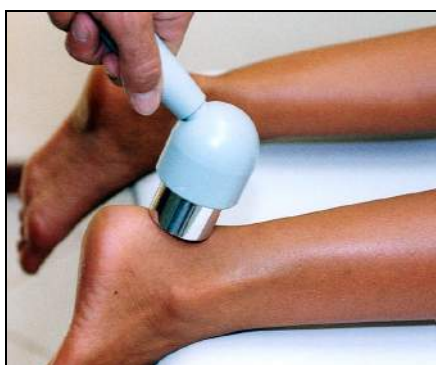
Fig.15 - Tendinite achillea