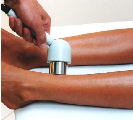
Fig.19 – Callo osseo su tibia