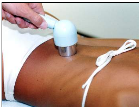
Fig.7 - Lombalgia