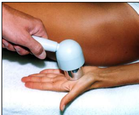
Fig.1 - Tunnel carpale