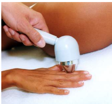
Fig.17 - Artrite delle dita della mano