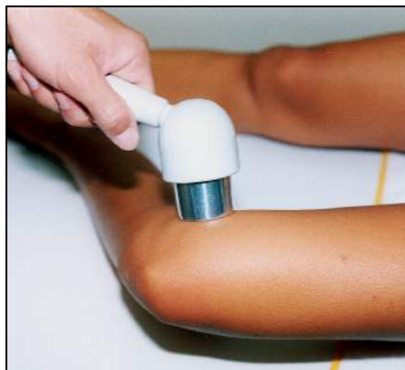
Fig.11 - Artrosi del ginocchio