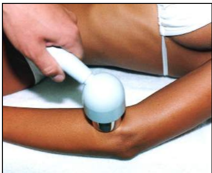
Fig.3 - Epicondilita