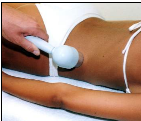
Fig.4 - Fianchi