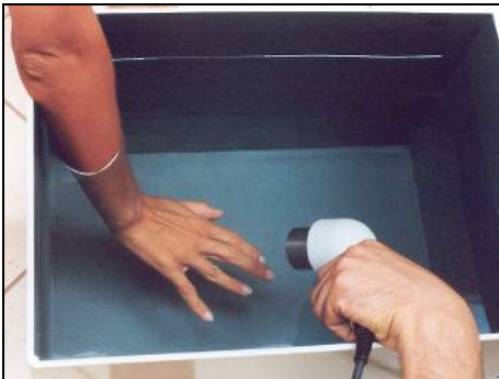
Fig.17 - Artrite della mano in immersione