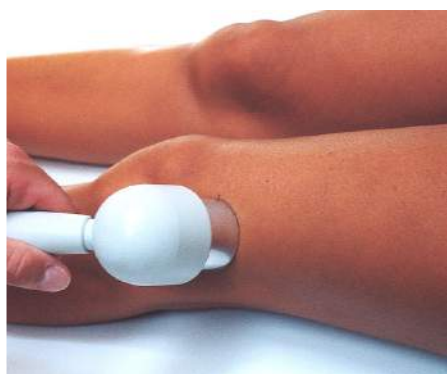
Fig.9 – Gonfiore al ginocchio